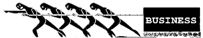
Figura del Líder